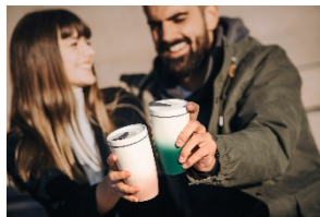
Coffee To Go

Vasen von Manufacture Collier in Beige, Taupe oder warmem Terracotta greifen den Trend auf und unterstreichen durch ihre matte Oberfläche den natürlichen Look.