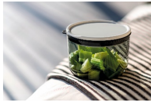
To Go & To Stay

Unser Zuhause sind nicht immer unsere eigenen vier Wände: Es kann genauso gut ein bestimmter Platz im Freien sein, Menschen, mit denen wir unser Leben teilen oder ein Gefühl, das wir überallhin mitnehmen. Jetzt, wo wir wieder mehr unterwegs sind, können wir diese wiedergewonnene Freiheit voll auskosten: Mit Coffee To Go-Bechern und stylischen Lunchboxen aus Porzellan oder Glas lassen sich Snacks und Getränke unkompliziert mitnehmen, ohne Verpackungsmüll zu produzieren – gut für uns und für die Umwelt.