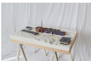
Transformation und Wandel/ Zukunftsorientiertes Wohnen an der Rhume Technische Universität Braunschweig, Antonia Hoffmeier